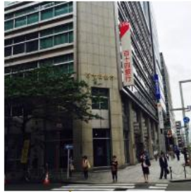
百十四銀行の交差点