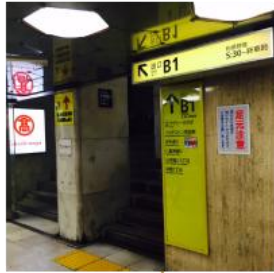
日本橋駅 B1 出口