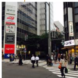
東京駅前の交差点